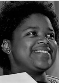
Africa del Sur