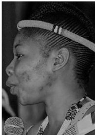
África del Sur