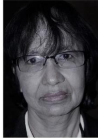
Myanmar southasia.president @wfmucw.org