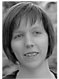
Hungría europe.vice-president @wfmucw.org