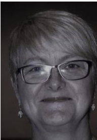
Irlanda britainireland.president @wfmucw.org