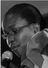
San Vicente & Granadinas