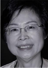
Hong Kong eastasia.president @wfmucw.org