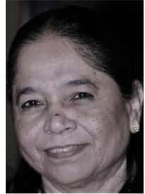
India southasia.vice-president @wfmucw.org