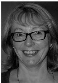
Inglaterra britainireland.vice-president @wfmucw.org