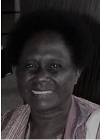
Presidenta Joy Jino Islas Solomon southpacific.president @wfmucw.org