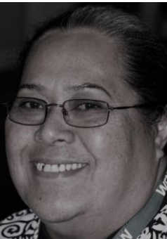
Leu Pupulu Nueva Zelanda