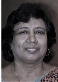
Malasia eastasia.vice-president @wfmucw.org