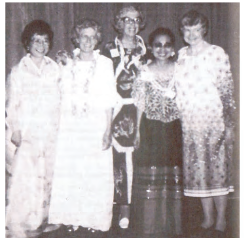
ஐந்து பிரசிடென்ட்ஸ் - ஹானலுலு WFMW அசெம்பளி-ஜலை 15-21, 1981

மெத்தடிஸ்ட் பெண்களின் உலகக் கூட்டமைப்பின் பிரதிநிதிகள். அமெரிக்காவின் பாசடினா (கபோர்னியா), அக்டோபர் 26, 1939-கூட்டமைப்பு உருவாக்கப்படும் போது.