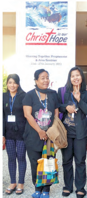
மூ கே - HKMS 2006, 2011 (வலது கடைசியில்) - தென் ஆசிய ஏரியா கருத்தரங்கில் பங்கேற்பு.