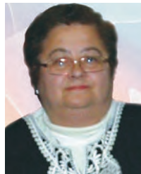
மகரிட்டா தோடோரோவா பிரசிடென்ட் ஐரோப்பா- கான்டினென்டல்